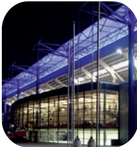
Die selbstreinigende Glasfassade vor der in der Vereinsfarbe beleuchteten Westtribüne.

Der Entwurf der Arena stammt von dem Dortmunder Architekturbüro ar.te.plan. Er kombiniert im Innenraum des Stadions eine stimungsfördernde Kompaktheit mit einem großzügigen Ambiente, das durch freie Sicht von allen Plätzen hervorgerufen wird. In das Gebäude vor der Westtribüne sind u. a. Logen, gastronomische Einrichtungen, ein Business-Bereich, der Fan-Shop und die Geschäftsstelle des MSV integriert. Die offene, gläserne Gestaltung des lichtdurchfluteten Foyers dient als