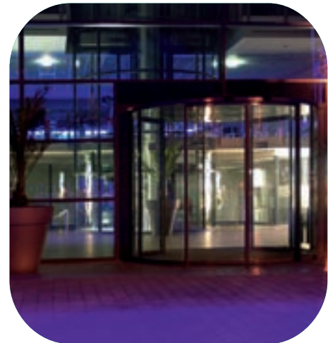
Durch eine Glasrehtür gelangen Besucher in das lichtdurchflutete Foyer, das ganzjährig geöffnet ist.

kommunikative Begegnungsfläche für die Besucher. Neben den für ein Stadion typischen Baustoffen Beton und Stahl spielt Glas als modernes Gestaltungsmittel eine wichtige Rolle. Dem Gebäude vorgelagert ist eine 120 Meter breite und 11 Meter hohe Glasfassade. Die insgesamt vier Ebenen des Hauptgebäudes verbindenden Aufzüge erlauben einen Blick in die darunter liegende großzügige Lobby.